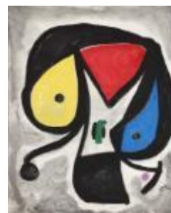
Joan Miró. Personnages et oiseaux avec un chien , 1978 Acrílic i oli sobre tela Fundació Joan Miró, Barcelona © Successió Miró 2021