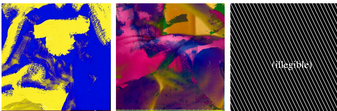
P. Staff. Jocs d'impacte , 2023. Stills

A Jocs d'impacte , P. Staff estableix un paral·lelisme entre alguns dels recursos visuals d'aquestes pel·lícules i les tècniques clíniques per a la visualització del cos: ressonàncies magnètiques, ultrasons, raigs X. Per a l'equip comissarial, «es tracta d'imatges potenciades òpticament que aprofundeixen la medicalització del cos alhora que fan palesos contrastos de textura, densitat i temperatura humanes que revelen l'àmbit somàtic com un lloc de variació integral». Així, els cremats i les taques de color que s'associen a la pel·lícula com a suport físic apareixen sobreposats a pell humana per fer èmfasi en la permeabilitat dels cossos. Aquests efectes visuals són interromputs per representacions de fesomies estranyes que l'espectador tan sols pot intuir. Tot això es completa amb un poema entretallat que anomena diverses parts del cos i formes de contacte corporal i que es va accelerant fins fer-ne impossible la lectura.